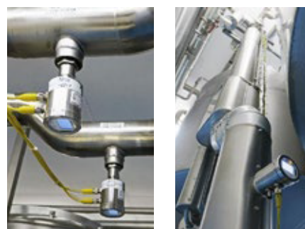
Versão remota ILM-4R